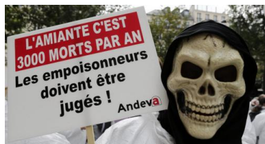
Lors d'une manifestation pour les victimes de l'amiante en France.

La plus haute juridiction confirmera probablement l'annulation : elle a déjà statué ainsi en 2015, dans un autre dossier capital, celui de Ferrodo-Valéo dans le Calvados ( lire ici nos explications ). Elle anéantira ainsi le dernier espoir des victimes que se tienne un jour en France un procès pénal et que soient clarifiées les responsabilités des industriels et des pouvoirs publics. Le rôle de l'État – pour avoir tant tardé à prohiber la fibre fatale –, est pourtant au cœur de l'affaire : la France n'a interdit l'amiante qu'en 1997, alors que sept pays européens avaient déjà banni ces fibres classées cancérigènes depuis 1977.