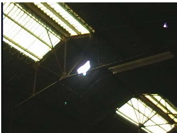
Trous dans la toiture .