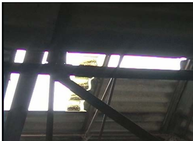
Plaque de toiture arrachées par le vent.