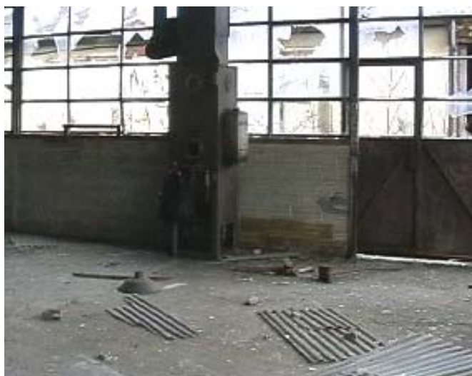
Plaque de toiture tombées au sol.